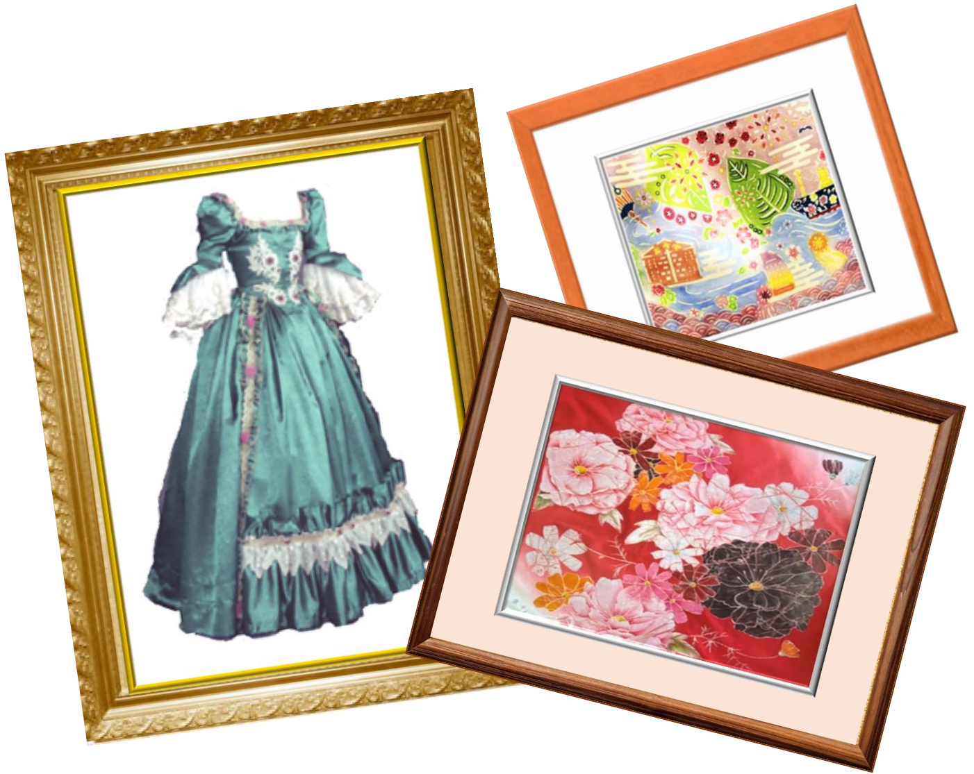
左:『白鳥の湖』王妃の衣装 右上:紅型クッションカバー 右下:ろうけつ染風呂敷

2025年度から町田キャンパスに生活共創学科と子ども教育学科が誕生します。今までの生活デザイン学科(衣生活領域)の活動を記念して、今回、卒業制作・地域連携活動の作品を展示しました。