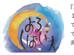
『三人がよるほい』 10月上旬に渋谷 宮益坂barKIZUKIで行われる舞台。その中でCM製作で参加している。興味のある方は是非ご覧ください。

【WEB】 http://yorushibai.blue/ 【公演日程】 2016年10/4(火),6(木),8(土),12(水),14(金),18(火) 20:00開演 ※1時間前に開場 【場所】 バー キズキ 東京都渋谷区渋谷1-8-5 グローリア宮益坂10F tel:03-6434-1309 URL: http://kizuki.bar/