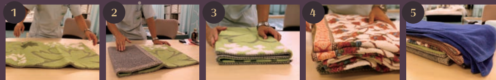
1 玄関マットを用意する。 2 玄関マットを三つ折りにする。ポイントは側面が直角になること。 3 玄関マットの上にタオルケットを乗せる。 4 必要があればタオルケットで高さを調節する。寝返りがし易いかどうかを確認。 5 完成！

材料は、玄関マット(毛足が短い、大きさが60×90くらい、裏地がしっかりある、硬い)とタオルケット(毛足が短い、ふわふわしていない、洗いざらし)です。さっそく用意して自分だけの枕を作ってみましょう。手順は右の通りです。