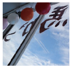
『馬鹿っこいい動画』 自身初の作品。撮影期間3ヶ月、素材時間500時間を超え、色々な意味で後にも先にも一番苦労したであろう作品と語っている。