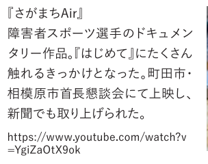
『さがまちAir』 障害者スポーツ選手のドキュメンタリー作品。『はじめて』にたくさん触れるきっかけとなった。町田市・相模原市首長懇談会にて上映し、新聞でも取り上げられた。 https://www.youtube.com/watch?v=YgiZaOtX9ok