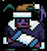
スリーピネスサタン LV.378