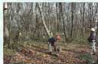
▲森の再生のために密生した木を切り太陽の光が地面に当たるようにします

「NPO法人 相模原こもれび」 【連絡先】090-4629-4843 URL: http://komorebi.bine.jp