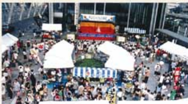
▲銀河まつりでにぎわう瀬野辺駅前

ていた銀河まつりに、大学生も参加するようになりました。大学生が模擬店での仕入れから販売まで経験してみたり、ステージでダンスなどを発表してみたり。中には、このお祭りを通じて自身の取り組む課題研究を行う学生も。学生の参加が、活気や発想など、今までにはなかったものを商店街にもたらしたのです。