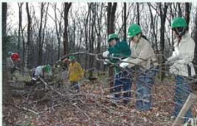
▲伐採した木を50㌢づつ切って整理します

体験とシイタケホダ木ゲット」でした。シイタケのホダ木を作るために、のこぎりで樹齢10~20年のコナラの木を伐採し、その木を適当な長さで切り適度に乾燥させます。その後、シイタケ菌を植え付けるという作業を行います。キコリ体験でのこぎりを使って木を切り倒すときの注意など丁寧に教えてくださったり、作業後にみんなで輪になって豚汁を食べながら話したり、すごく親しみやすい現場でした。この豚汁に入っていたシイタケも以前ボランティアで作ったホダ木から採取されたもので、とてもおいしかったです。