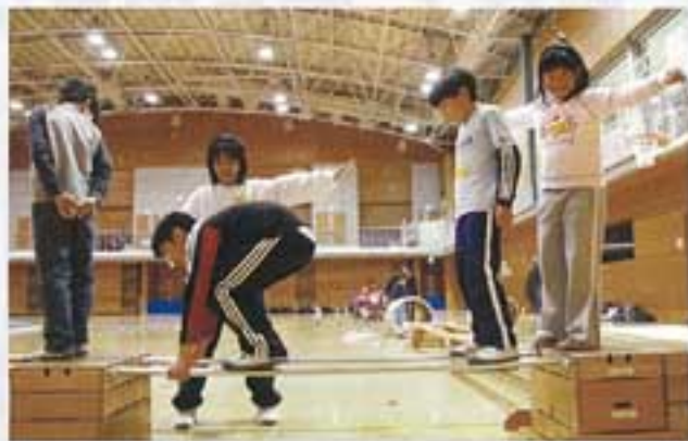
▲障いバンプを渡る子どもたち