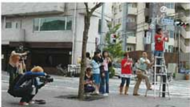
▲脚立持参で参加した学生

この「フォトシティさがみはら 子ども写真教室」は小学生たちにとっても最高の体験機会ですが、それを題材にプロモーションビデオを制作する大学生にとっても、