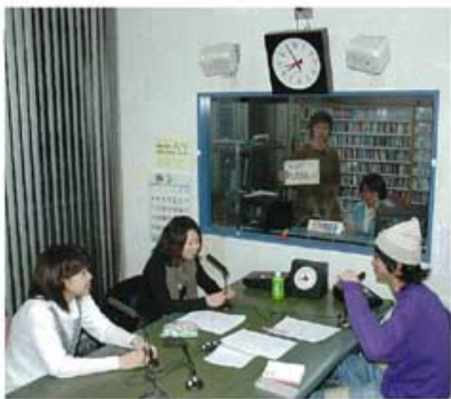
▲すべてが学生による手作りの番組「インターズラジオ」

組です。そして今、放送を担当しているのは、インターズ2期生です。この「インターズラジオ」が、同年12月26日の午前11時から、特別番組「インターズラジオ・忘年会」として生放送されました。