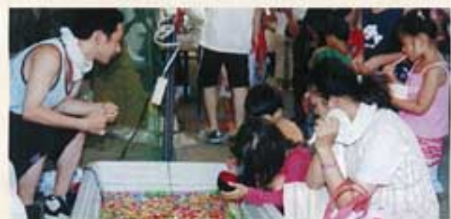
▲銀河まつりで盛装中の麻布大生