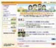
▲研究会HPのトップページ

ホームページでは、相模原・町田を中心としたエリアの大学や加盟団体が実施する公開講座や広く市民の皆様が参加できるイベントなど、多彩な情報をリアルタイムに発信してきました。