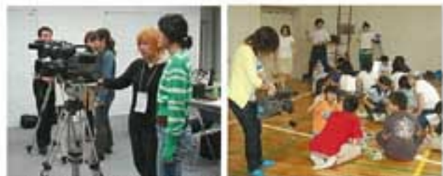
▲カメラ操作の学習をする学生

試写する学生は真剣そのもの。大学の授業では得られない緊張感を学生たちは味わっていました。それから何度も編集をし直した後、ついに上映の機会が訪れました。学生たちにとっては自分たちの感性を披露する