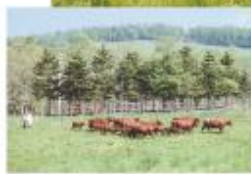
▲ 牧場内を移動する牛