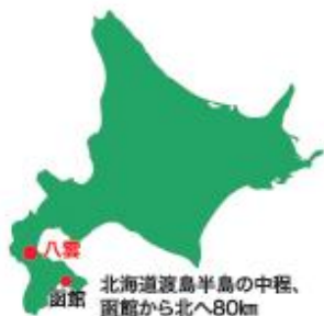
北海道渡島半島の中程、函館から北へ80km

ここでは、広大な草地・林地を有する立地条件を生かし、「物質循環を重視した自給飼料による環境保全型牛肉生産」を基本方針に、夏は放牧、冬は貯蔵粗飼料で飼育し、家畜の排泄物は完熟堆肥として草地に還元するシステムについて実証的研究を進めています。