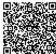
さがまちカレッジ

または、さがまちコンソーシアムホームページのさがまちカレッジ申し込みフォームに必要事項を入力して、送信してください。