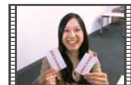
2014年度作品 国民年金基金TV-CM(ババ抜き編)

神奈川県国民年金基金TV-CM制作プロジェクトに参加しようと思っ たきっかけを教えてください。 ① 大学でテレビ番組を作る授業があり、その仲間6・7人でCM制作にもチャレンジしようということになりました。応募企画が46作品もあり、その中から16作品がプレゼンの機会を得、制作に進んだら作品に残ることができました。私個人としては、2年連続でCMを作った人はいないのでそれも達成してみたいとチャレンジしました。 ② 僕は元々高校時代から映像制作をやっていたので、個人的に作っていたんですが、学校で作るという機会には恵まれなくてたまたまそういう機会があったので自分の力を出したいと思いチャレンジしました。 ③ 今回の作品のコンセプトはなんですか? ④ 国民年金基金をより多くの若い人